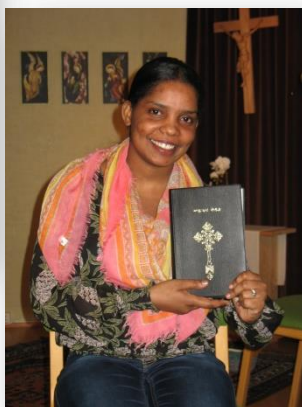
TAKK for Bibel på eget språk!