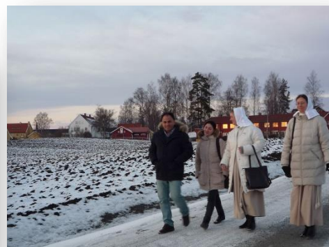
Med iranske venner på bønnekonferanse, Grimerud

© 2016 De Evangeliske Mariasøstre Opstuen 20, 2266 ARNEBERG, tlf. 62 95 31 02, www.evangeliskemariasostre.org Bankkonto: 1904.20.30360: De Evangeliske Mariasøstre, 2266 Arneberg