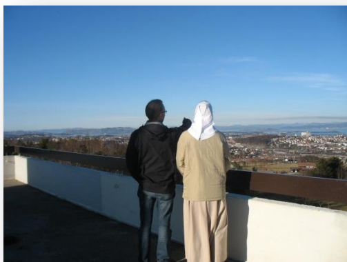
Fra reisen til Sør-Vestlandet